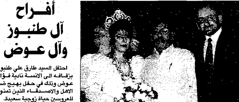
● العروسان مع والد العروس